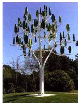
L' Arbre à vent , créé par Claudio Colucci, grâce à la Fondation ENGIE, (©ENGIE)

gétiques d'ENGIE a assuré le chauffage de la moitié des installations, via une chaudière alimentée par du biogaz, tandis que la fondation d'entreprise de l'ex-GDF Suez a installé deux éoliennes biomimétiques (les Arbres à vent conçus par le designer Claudio Colucci) à l'entrée du site du Bourget. EDF, engagé dans la transition énergétique par le biais de sa filiale EDF Énergies nouvelles et au moyen d'investissements dans le développement des énergies renouvelables, a fourni au site du Bourget une électricité faiblement carbonée et a installé des bornes de recharge pour alimenter les voitures électriques sur le site de la conférence. Alors que l'Espace Fondation EDF à Paris accueille l'exposition « Climats artificiels » jusqu'au 28 février (lire p. 36), la société de production et de distribution d'électricité soutient le programme 10 projets pour le climat, dont le jeu en ligne Caire Game de l'association Art of Change 21 qui permet aux particuliers d'agir à leur échelle contre le réchauffement climatique en faisant des économies de CO 2 .