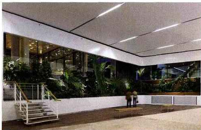
03 — Le hublot 3D. A la confluence du Rhône et de la Saône, ce grand cadre blanc symbolise un hublot de bateau. Lors de la croisière fluviale, on voit la jungle tropicale, des rivières et des cascades de pierre.