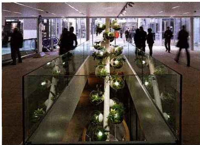
02 — L'arbre à bulles. Il ressemble à une grosse grappe de fruits avec 17 bulles lumineuses comme autant d'écosystèmes. Il traverse deux étages, sur 6 m de hauteur, pour créer un lien entre l'accueil et le sous-sol du centre commercial.