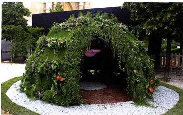
04 — L'igloo tropical. Cet oxymore (froid/chaud) rappelle que le pôle Nord dégèle à une vitesse vertigineuse, mettant en péril les Inuits. L'igloo peut accueillir jusqu'à 10 personnes. Il est confortable et éclairé par une lumière douce. A louer pour une manifestation professionnelle, environ 20 000 euros.